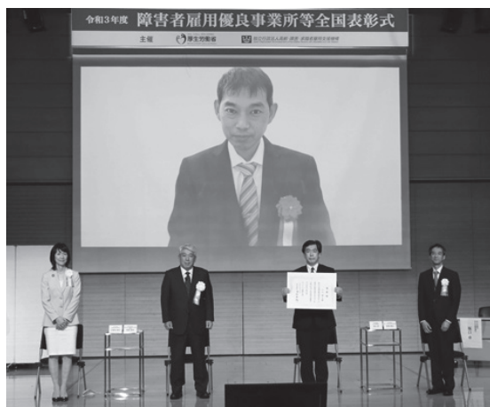
表彰後の記念撮影の様子

今年度の表彰式は、新型コロナウイルスの感染拡大防止のため、式典の様子をライブ配信し、受賞者は全員、オンラインで参加しま