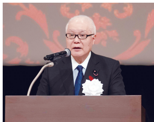
挨拶を行う武見厚生労働大臣

今年度も高年齢者がその能力、経験を十分に活かし、いきいきと働くことができるような創意工夫がなされている企業の事例が寄せられました。